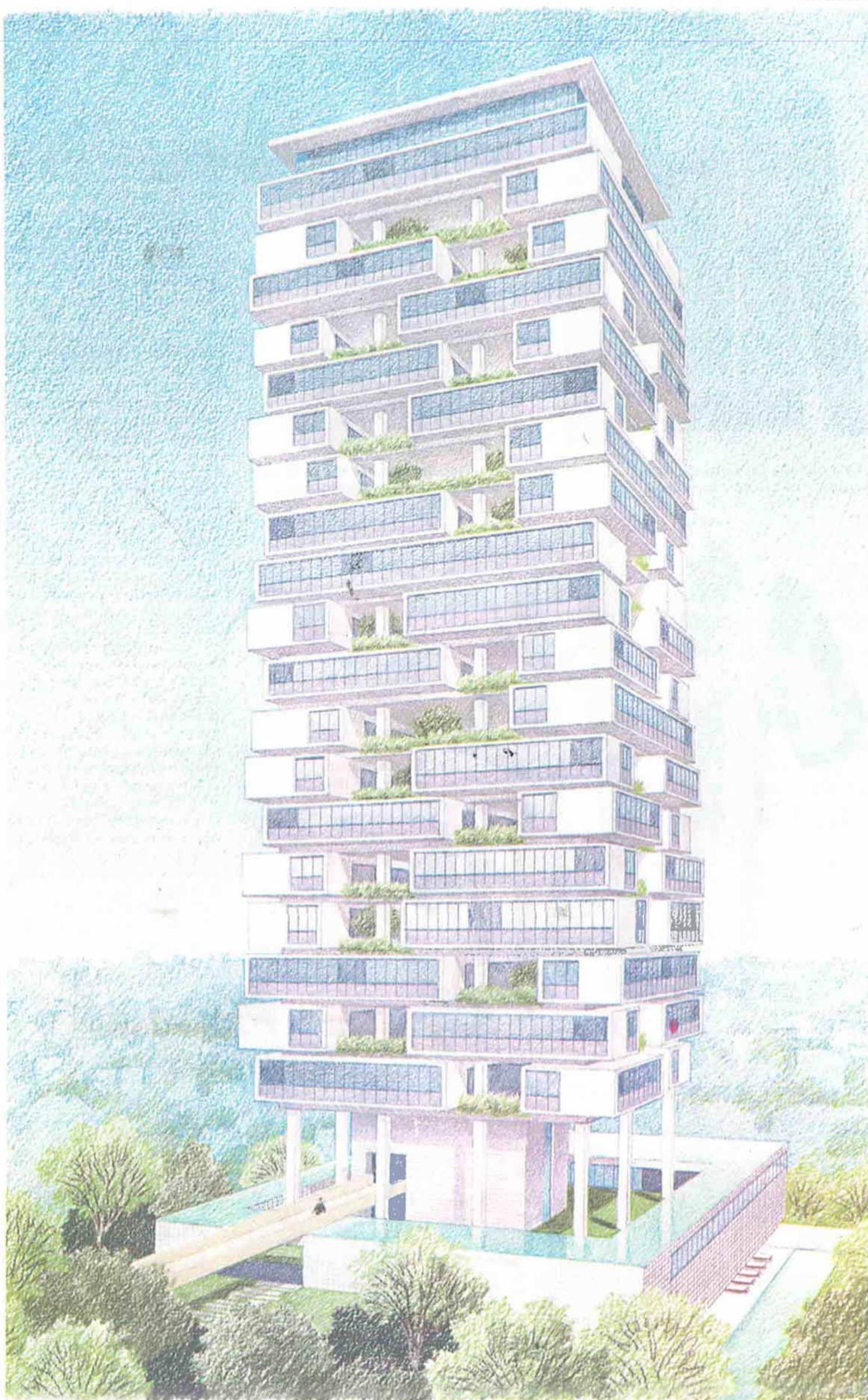
O edifício 360°, que será entregue em 2011, privilegia a fachada projetada e é francamente inspirado em Le Corbusier

A nova onda é contratar uma empresa que realiza um diagnóstico sobre onde o processo de construção mais impacta o meio ambiente. "Eu acredito em reciclagem e reuso de água, mas é mais eficiente ser consciente durante o processo, e não depois", diz Neuding, que acredita na compra de créditos de carbono na bolsa de Chicago como uma opção de estar em conformidade com o meio ambiente.