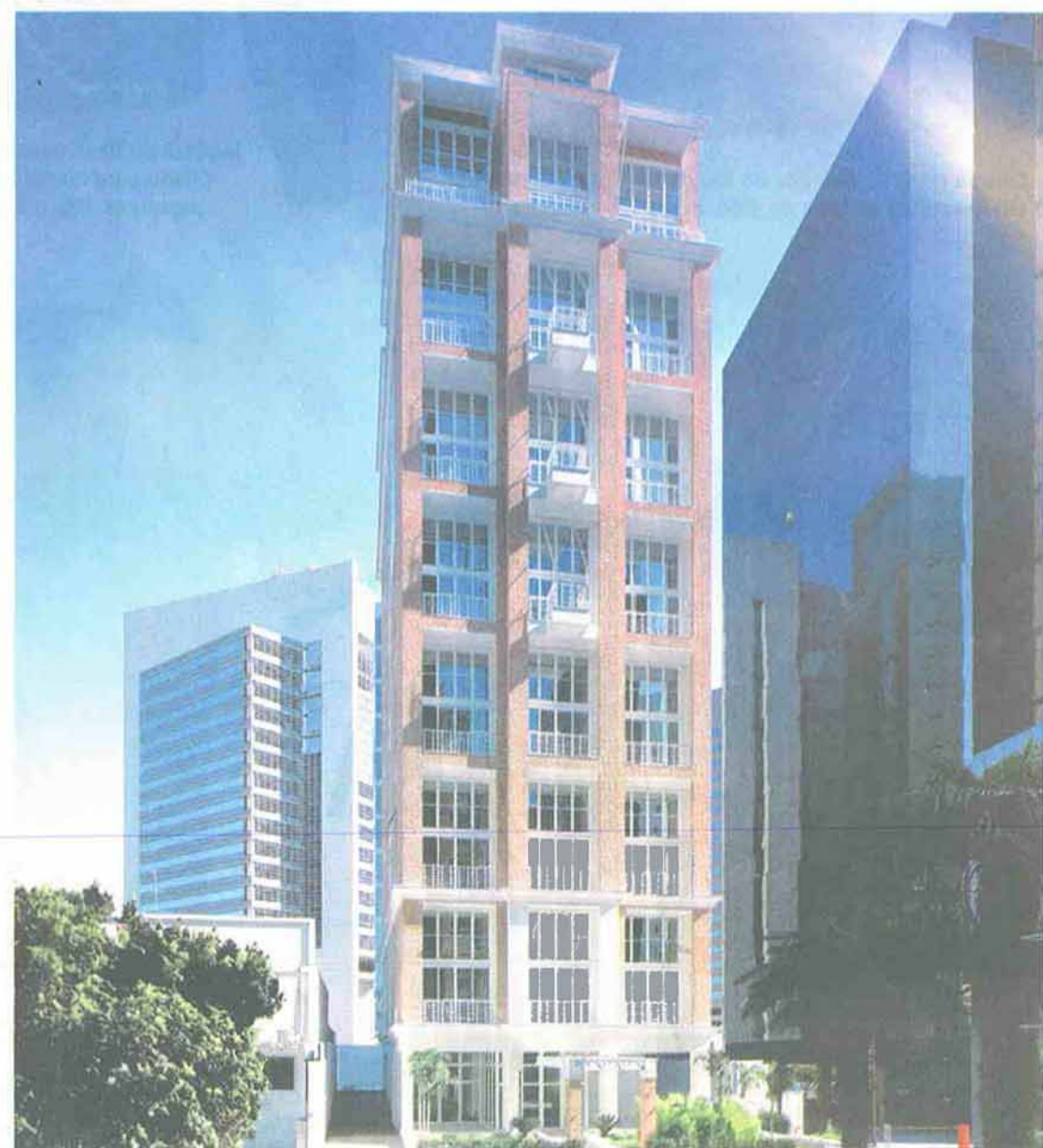
Vista frontal do Loft Office oferece uma nova visão de um prédio corporativo, com janelões