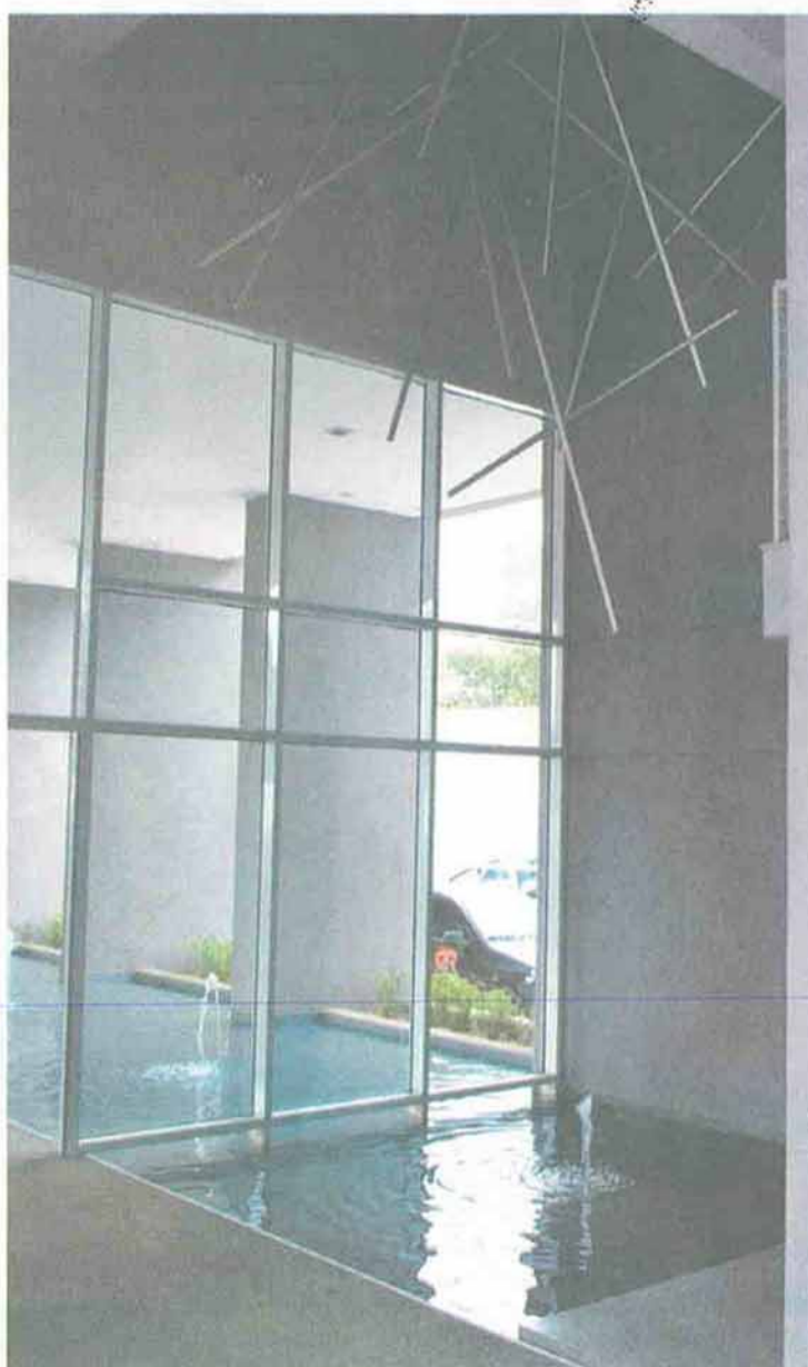
O hall do edifício Arte Arquitetura tem obra dos irmãos Campana