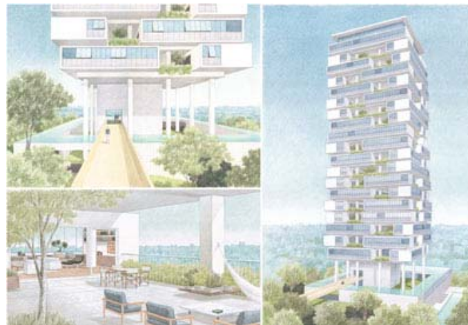
O hall de entrada, a fachada do prédio e a vista das "casas suspensas", de Isay Weinfeld